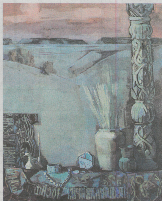
«Клады Старой Рязани. Негасимая свеча», 2020 г.