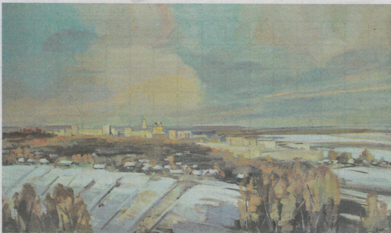
«Праздничный день. Покров», 2002 г.

Татьяна Кармашова