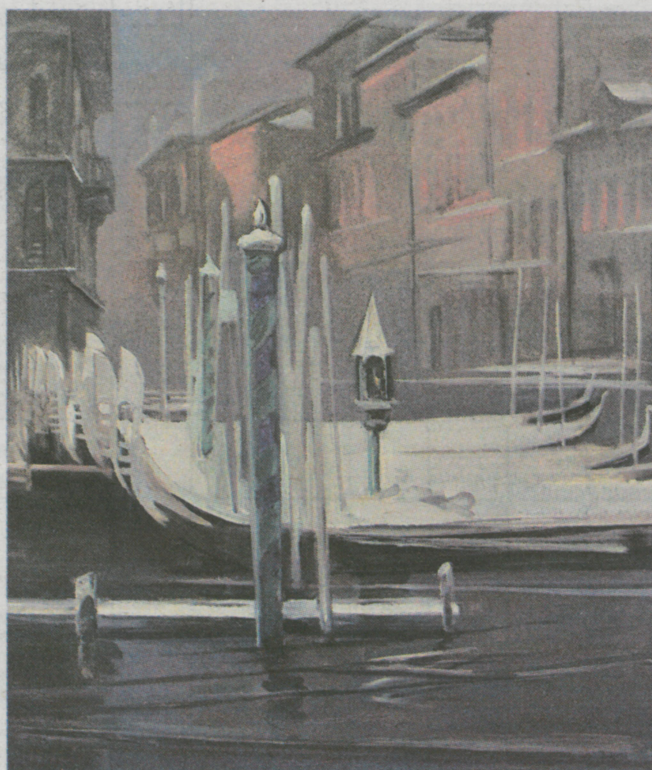
«Сон», 2006 г.